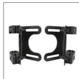
PD 11 4-Point Pro