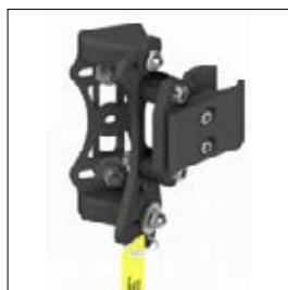
PD 10 2-Point Pro, zugelassen für KMP-Transport