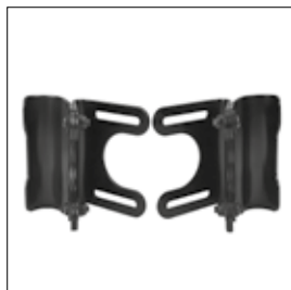
PD 09 Basic Release