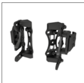
PD 08 Quick Release