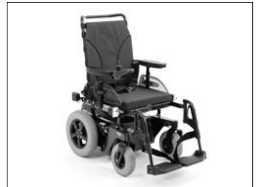
Abbildung zeigt Aufpreispositionen

Artikel-Nr. Heckantrieb: 490E75=1_AC01_C max. Zuladung: 160 kg