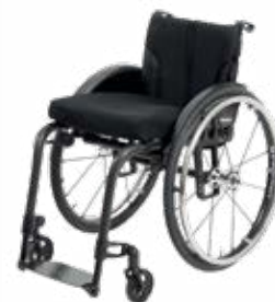
Zenit R Carbon