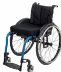
Zenit R Aluminium