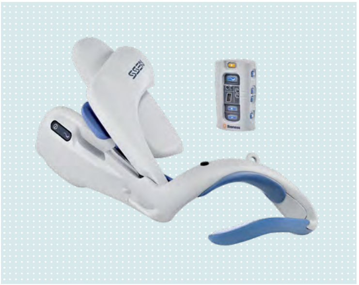
• H200 Wireless System